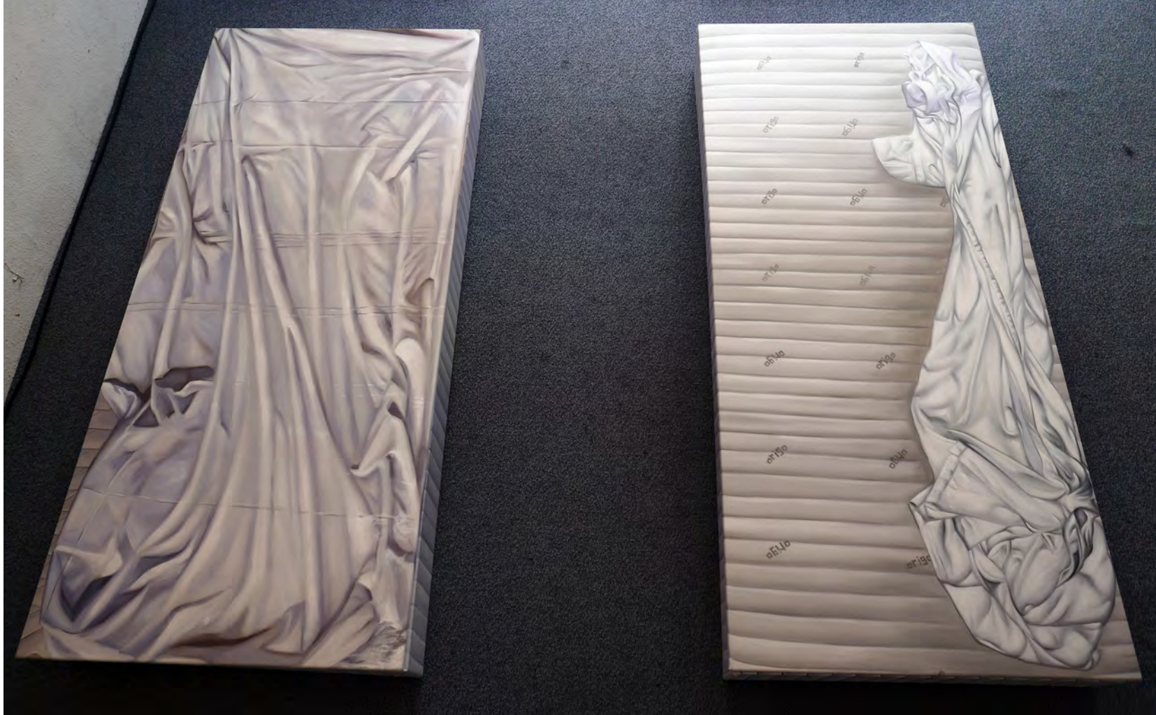
„Room Number 1“, Detailansicht, Öl auf Leinwand (verschraubt), jeweils 30 x 100 x 200 cm, 2016 „Room Number 1“, Detail, Oil on canvas (fastened together), each 30 x 100 x 200 cm, 2016