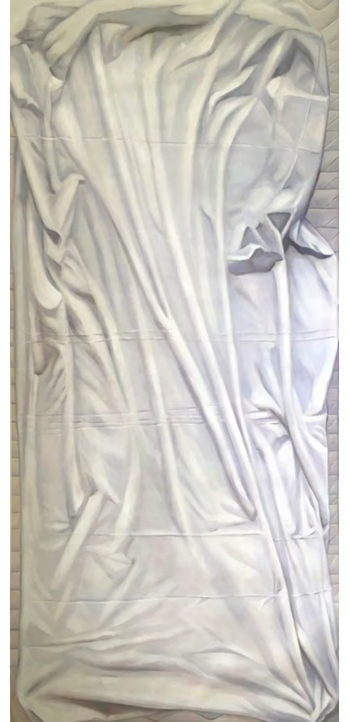
„Room Number 1“, (Draufsicht), Öl auf Leinwand, jeweils 30 x 100 x 200 cm, 2016 „Room Number 1“, Topview, Oil on canvas (fastened together), each 30 x 100 x 200 cm, 2016