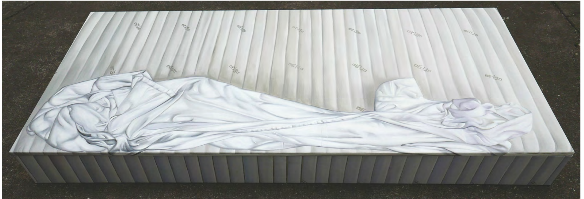
„Room Number 1“, Detailansicht, Öl auf Leinwand (verschraubt), 30 x 100 x 200 cm, 2016 „Room Number 1“, Detail, Oil on canvas (fastened together), 30 x 100 x 200 cm, 2016