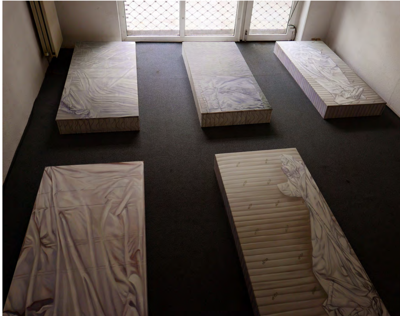
Installationsansicht „Room Number 1“, Berlin Neukölln 2016 Installation view „Room Number 1“, Berlin Neukölln 2016