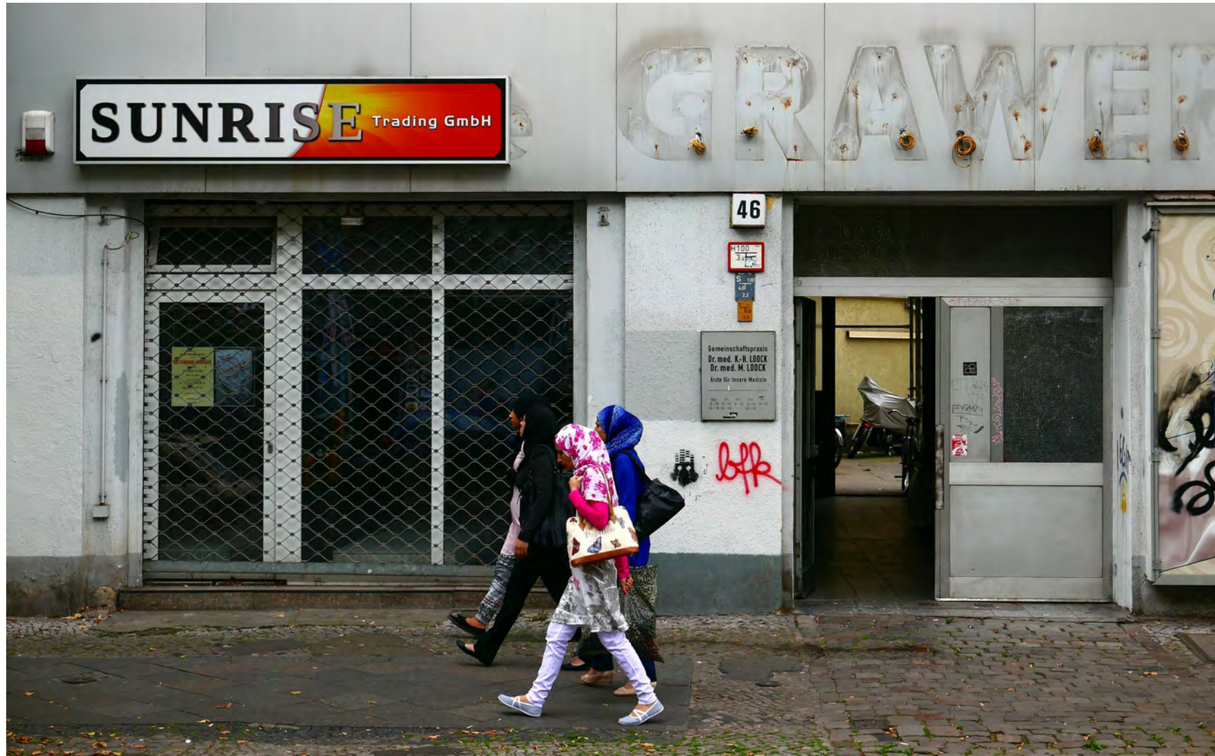
Ausstellungsort, Berlin Neukölln, 2016 Exhibition venue, Berlin Neukölln, 2016