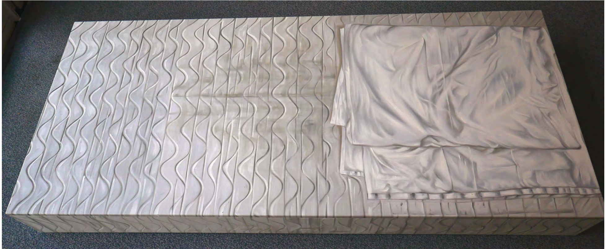
„Room Number 1“, Detailansicht, Öl auf Leinwand (verschraubt), 30 x 100 x 200 cm, 2016