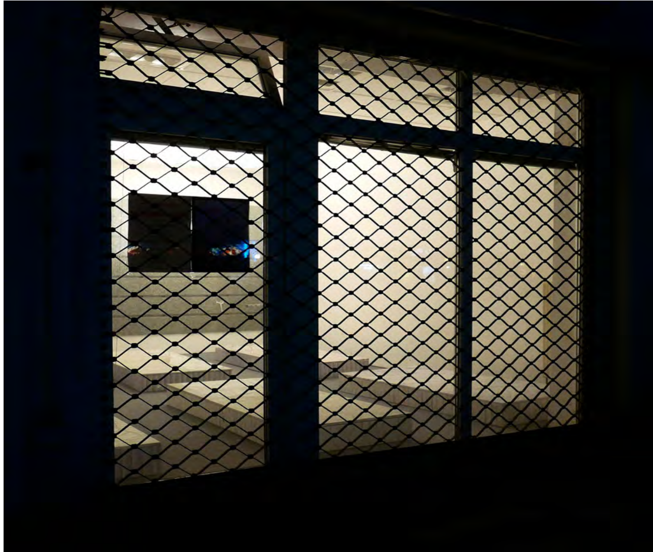
Außenansicht / Ausstellungsraum „Room Number 1“, Berlin Neukölln, 2016 Exterior view, Exhibition room, „Room Number 1“, Berlin Neukölln, 2016