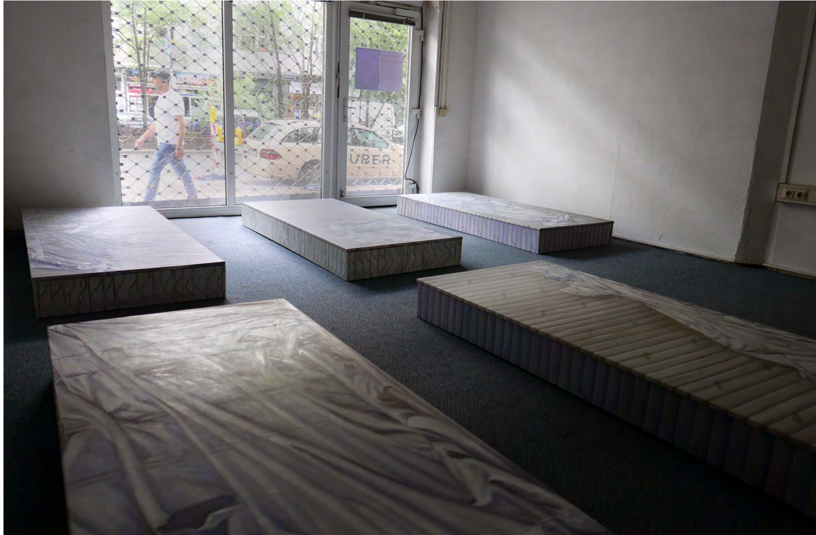
Installationsansicht „Room Number 1“, Berlin Neukölln 2016 Installation view, „Room Number 1“, Berlin Neukölln 2016