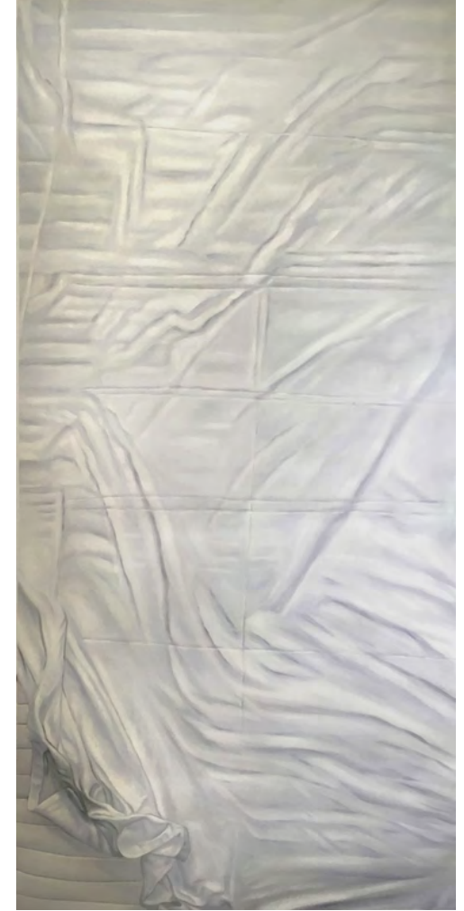
„Room Number 1“, (Draufsicht), Öl auf Leinwand, jeweils 30 x 100 x 200 cm, 2016 „Room Number 1“, Topview, Oil on canvas (fastened together), each 30 x 100 x 200 cm, 2016